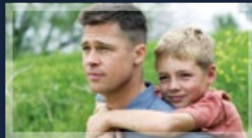
THE TREE OF LIFE