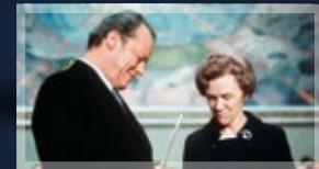
WILLY BRANDT – ERINNERUNGEN AN EIN POLITIKERLEBEN

Helmut Schmidt und Willy Brandt – zwei Vollblut-Politiker: Helmut Schmidt feiert am 23. Dezember 2013 seinen 95. Geburtstag und Willy Brandt wäre am 18. Dezember 100 Jahre alt geworden. Das Erste ehrt beide mit außergewöhnlichen Porträts.