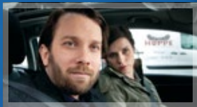
TATORT: DIE FETTE HOPPE