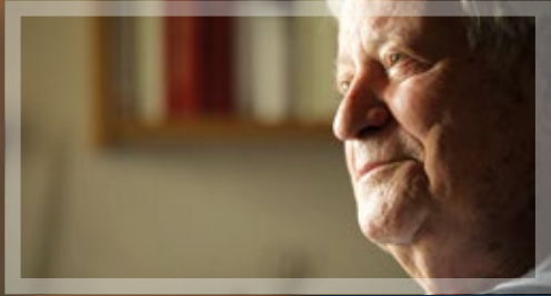
HELMUT SCHMIDT – LEBENSFRAGEN