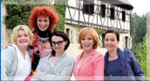
DIE DIENSTAGSFRAUEN – SIEBEN TAGE OHNE