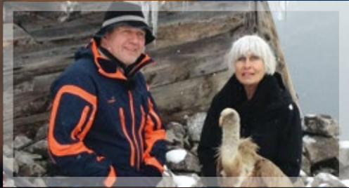
DRAMA AM GIPFEL