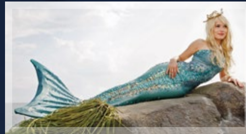
SECHS AUF EINEN STREICH – DIE KLEINE MEERJUNGFRAU

Noch mehr Informationen mit ausführlichen Presstexten finden akkreditierte Journalisten in der sechswöchigen Programmorschau unter : http://presse.daserste.de und Bilder zum Programm unter www.ard-foto.de