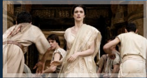
AGORA – DIE SÄULEN DES HIMMELS