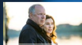
TATORT: BOROWSKI UND DER ENGEL

Unterhaltsames und Spannendes, großartige Schauspieler in Film- und Fernsehpremierer, interessante Dokumentationen, neue Märchenfilme, feierliche Momente, Wintersport und gewohnt Informatives – das Feiertagsprogramm im Ersten setzt Glanzlichter für die ganze Familie.