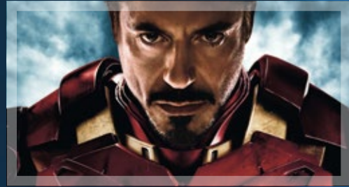
IRON MAN 2